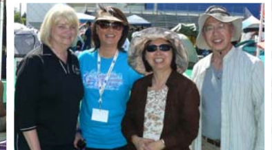
我們團體參加抗癌接力 (Relay for Life) 照片。