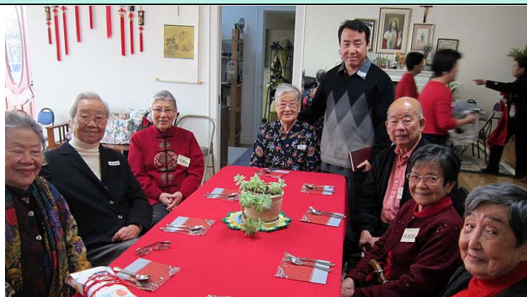
主言會修女為眾人報佳音。

最後再說一聲謝謝中半島的教友朋友們，精心安排這次盛會，讓我們這些年老體弱，活動受限制的人們，感到特別的溫馨，我們不但沒有被遺忘，而是時時刻刻得到你們的愛護與關懷。