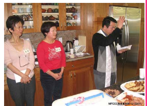
翟神父為主人家祝聖房子