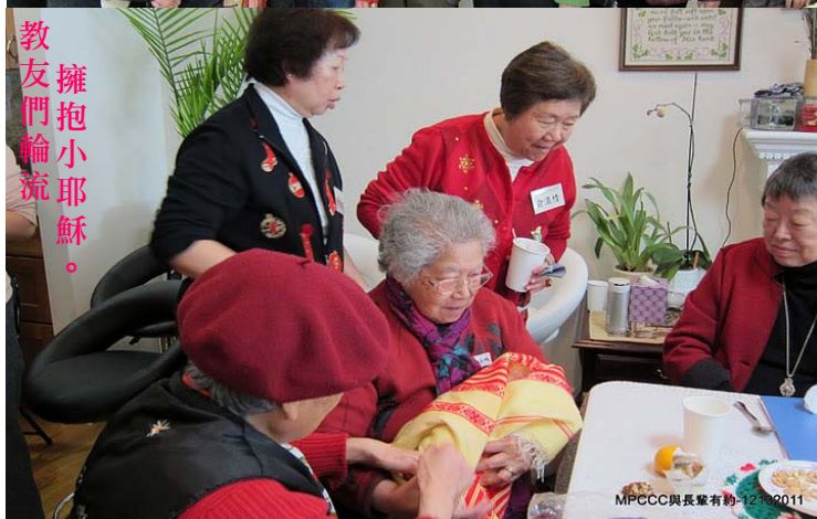
教友們輪流擁抱小耶穌。