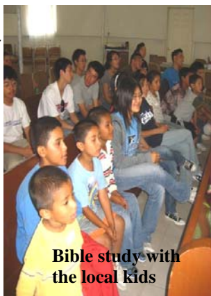
Bible study with the local kids

我記得，幾個月前我對美聽著馬汀.路德.金恩博士演講深刻。金恩博士引用了聖經中哥時遇上了強盜，被強盜攻是我幫了他，我會怎樣？耶穌人經過，他看到這個人，就將怎樣？金恩博士說，我們今天怎樣？我這才發現，幫助別人的種利己，付出已是一收穫，身他，他人會怎樣？這其實是一