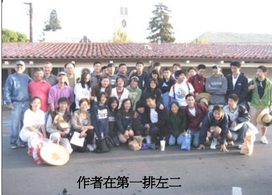
作者在第一排左二

有諺云：「人在福中不知福」，生活在富裕國家裡的人常因物質生活的蒙蔽而不懂得珍惜，甚至忽略了許多更可貴的事物。但當我們每天打開水龍頭使用乾淨溫熱的水，或其他我們認為理所當然的東西時，我們曾不想過這世界上仍有許多人無法享有這種生活呢？