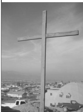
Our dormitory dome